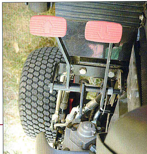
lůha je velmi jednoduška a pojezd se dá dvěma pedály

é hydraulice lze používat velký a nízko umístěný o se nalézá vně rámu, čímž se lépe chladí. Díky vy- dá dvěma samostatnými pedály. Hydraulické čer- /h. Převodovka je hydrostatická, směr jízdy se máhni rychlost při jízdě vpřed dosahuje 13, vzad v něm dieselový tříválec Shibaura o výkonu 26 k.