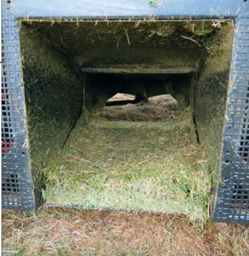
Rozměrný výhozový tunel pro bezproblémový transport trávy do koše je vybaven po celé délce čistící klapkou

vě je pohodlná sedačka s odklápěcími područkami a vysokým opěradlem.