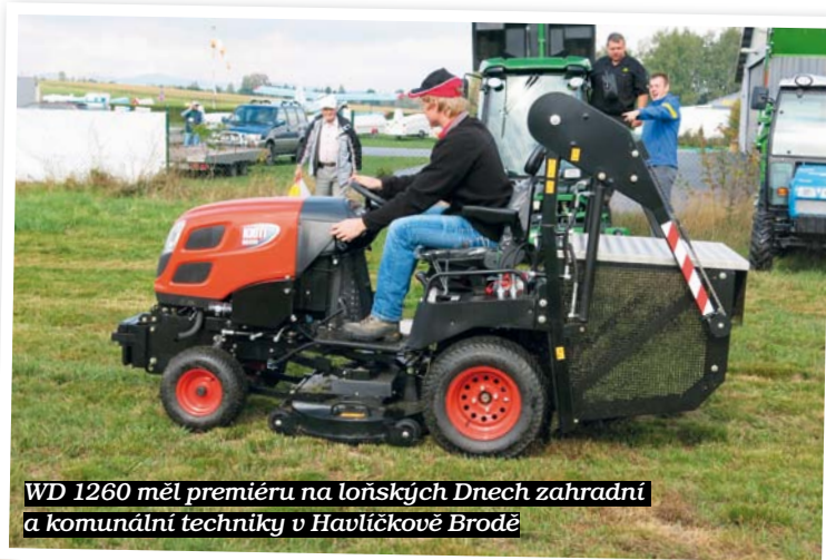
WD 1260 měl premiéru na loňských Dnech zahradní a komunální techniky v Havlíčkově Brodě

Traktůrek WD 1260 je výkonný a současně jednoduchý pro obsluhu. Určen je pro každodenní používání ve městech, obcích, u technických služeb, při údržbě travnatých sportovišť a pro všechny subjekty, které mají zeleň na starosti.