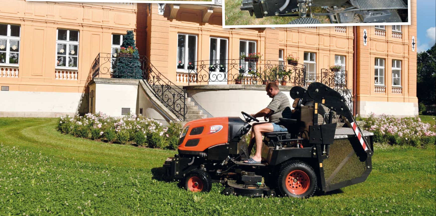
Travní traktor Kioti WD 1260 pomáhá v dětském domově v Nové Vsi při údržbě zeleně a sběru listí. Za volantem Václav Krulík