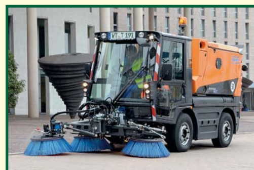
Swingo 200+ 3 kartáčový systém unikátní systém sání KOANDA se vrací