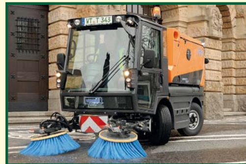
Swingo 200+ 2 kartáčový systém