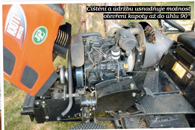
Cištění a údržbu usnadňuje možnost otevření kapoty až do úhlu 90°