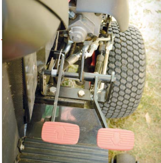
Obsluha je velmi jednoduchá a pojezd se ovládá dvěma pedály

Tepe v něm dieselový tríválec Shibaura o výkonu 26 k. Maximální rychlost při jízdě vpřed dosahuje 13, vzad 6 km/h. Převodovka je hydrostatická, směr jízdy se ovládá dvěma samostatnými pedály. Hydraulické čerpadlo se nalézá vně rámu, čímž se lépe chladí. Díky výkonné hydraulice lze používat velký a nízko umístěný odhazový tunel s čistící klapkou.