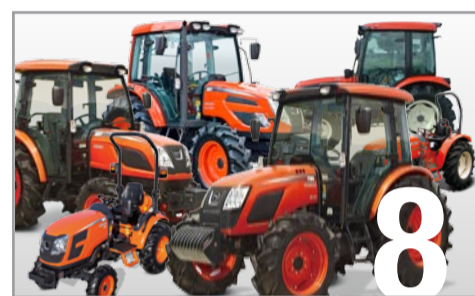
Traktory řady CK